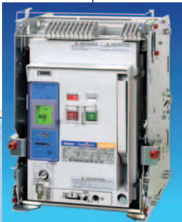
TERASAKI TEMPOWER 2 RETROFIT ACB