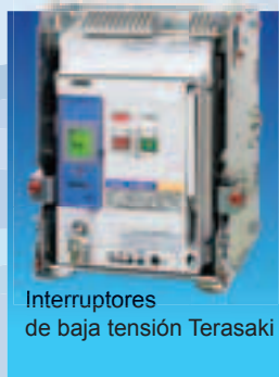
Interruptores de baja tensión Terasaki