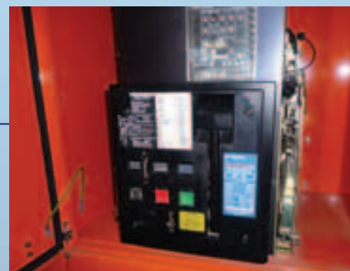
TERASAKI TEMPOWER AT

Diseñamos ACBs retrofit bajo petición. Si está interesado en una marca que no se halla entre las indicadas arriba estaremos encantados de estudiar su viabilidad. Constantemente añadimos nuevas marcas a nuestra cartera. Consulte la lista actualizada clicando en la descarga "application notes" en el link: