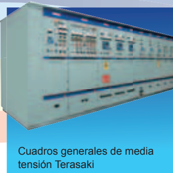
Cuadros generales de media tensión Terasaki