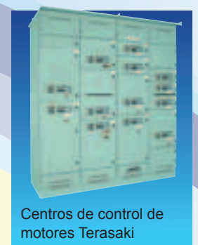
Centros de control de motores Terasaki