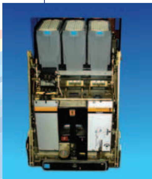
MERLIN GERIN SELPACT