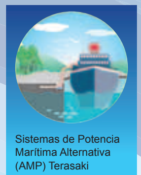
Sistemas de Potencia Marítima Alternativa (AMP) Terasaki