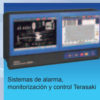
Sistemas de alarma, monitorización y control Terasaki