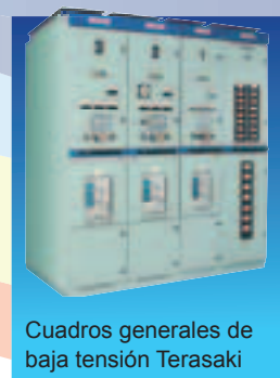
Cuadros generales de baja tensión Terasaki