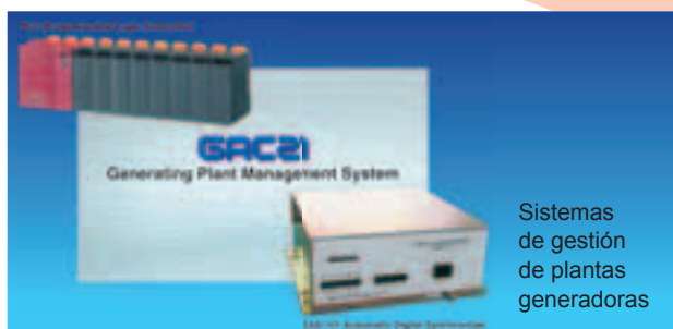
Sistemas de gestión de plantas generadoras